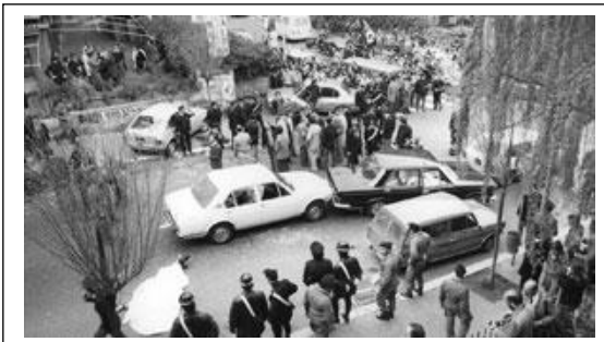
L'agguato sanguinario e il rapimento

Si trattava di un gesto politico di considerevole portata, i cui echi oltrepassarono i confini nazionali. Il PCI del segretario Enrico Berlinguer si diceva pronto al compromesso storico , rivendicando lo strappo con Mosca. Le resistenze però erano forti sia all'interno della DC, sia tra gli alleati internazionali dei due principali partiti italiani.