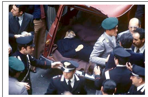
Il ritrovamento del cadavere in via Caetani

Inchieste giornalistiche successive fecero emergere il possibile coinvolgimento nella vicenda di altri soggetti, tra cui la Loggia P2 , la rete clandestina della NATO e i servizi segreti di diversi paesi. A supportarle gli innumerevoli ritardi e punti oscuri nelle indagini svolte all'epoca dei fatti e alcuni aspetti nella dinamica del sequestro e della prigionia, secondo alcuni, non riconducibili al modus operandi tipico delle Brigate Rosse.